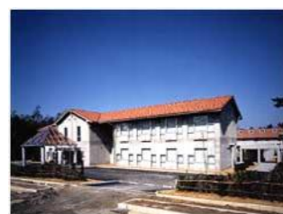
インテック 大山研修センター外観